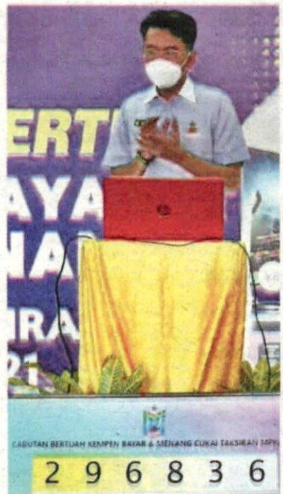
Najmuddin picking the winners of the lucky draw, which was broadcast on MPKj's Facebook page.

The public can check and pay their assessment taxes via https://ebayar.mpkj.gov.my/ebayar .