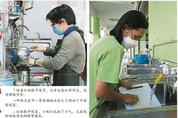
↑随着水供提早恢复，业者也能如常作业，欢迎顾客堂食。 →甲洞卫星市一带商舖的水供已于周四下午陆续恢复。 ↓水供提早恢复，小贩们也松了口气，尤其能好好地清洗碗碟等物品。